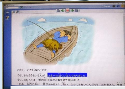
「日本の昔話 うらしまたろう」(浜なつ子/文 よこやまようへい/絵 (ワいわい文庫 Ver.BLUE)伊藤志記念財団 2013)